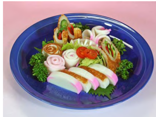
商標登録第5003857号 舞鶴かまぼこ