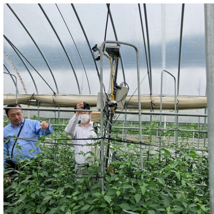
万願寺甘とう、及びセンサーの写真はイメージです。