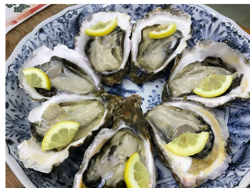
丹後の海 育成岩がき