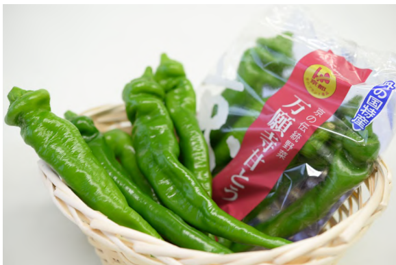
商標登録第5150710号 万願寺甘とう