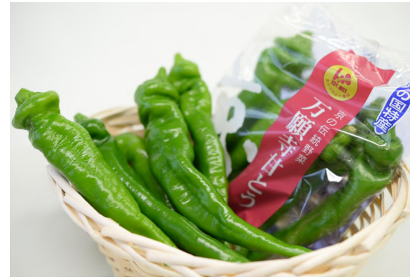
商標登録第5150710号 万願寺甘とう