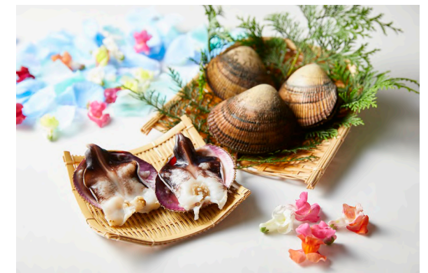
商標登録第5284808号 丹後とり貝