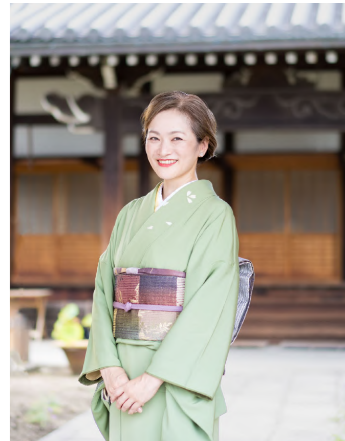
地域ブランドナビゲーター