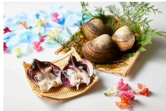
商標登録第5284808号 丹後とり貝