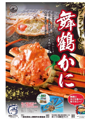
商標登録第5505413号 舞鶴かに